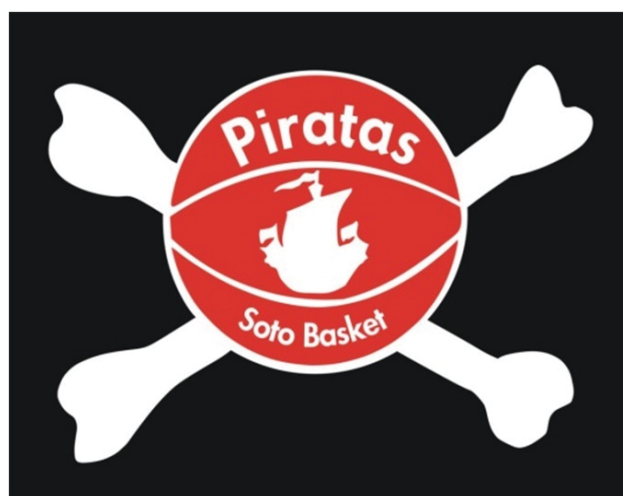
SALESIANOS SOTO PIRATAS