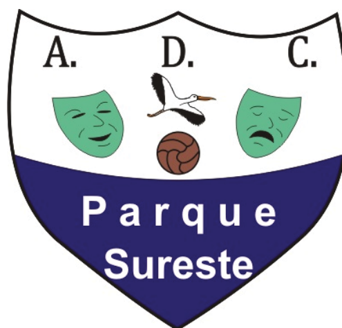
RIVAS P. SURESTE 'D'