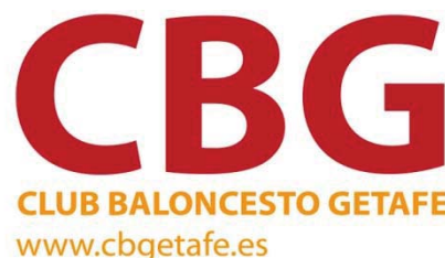
CB GETAFE 'A'