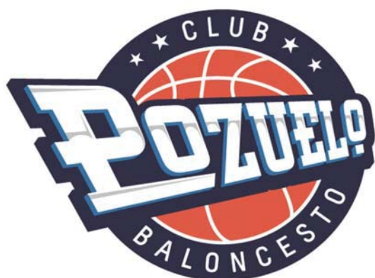
C.B. POZUELO 'D'