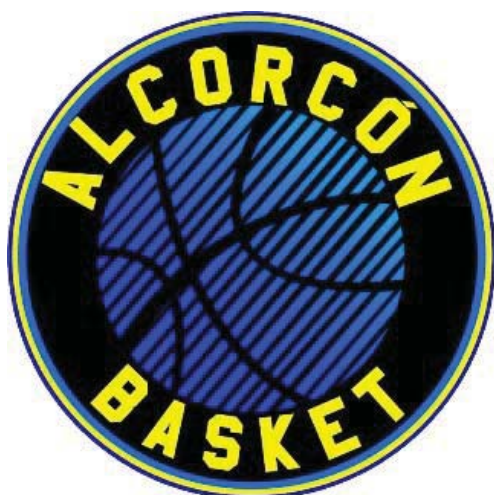
ALCORCON BASKET 'D'