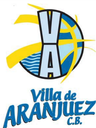
VILLA DE ARANJUEZ E. LECLERC