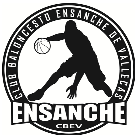
ENSANCHE DE VALLECAS