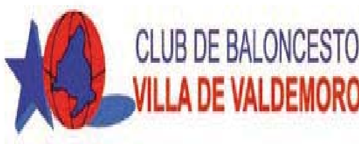
VILLA DE VALDEMORO 'A'