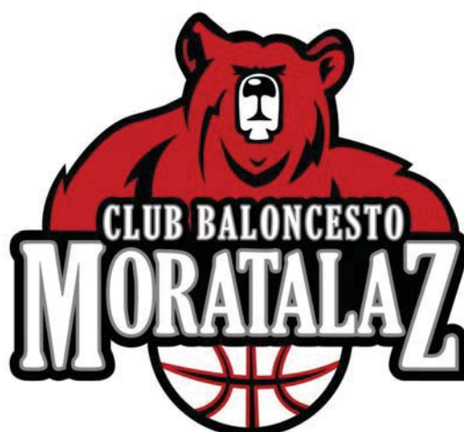
MORATALAZ C.B. 'A'