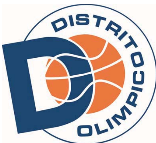
DISTRITO OLIMPICO ARCOS