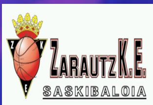
9. ZARAUTZ K.E. SASKIBALOIA