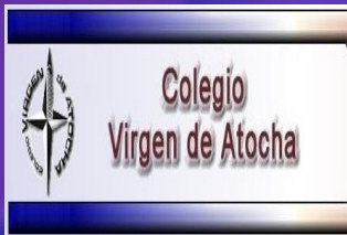
17.COLEGIO VIRGEN DE ATOCHA