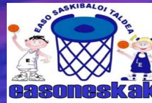
19.EASO SAN SEBASTIÁN