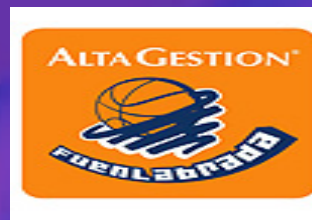
3. ALTA GESTIÓN FUENLABRADA