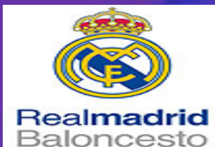
5. REAL MADRID