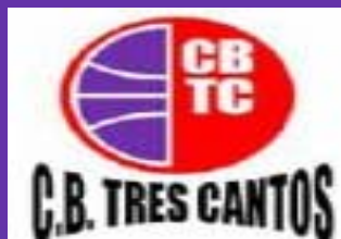
2. C.B. TRES CANTOS