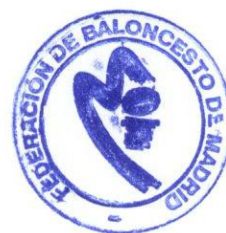
LA COMISIÓN DELEGADA