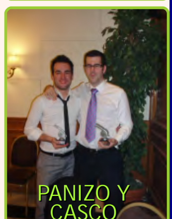
PANIZO Y CASCO