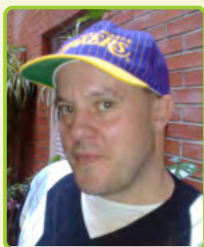
Por Manuel Lechón.

Rodeado de una cantidad de secundarios importante, el propio director es el que hacía de contable en Los Intocables de Elliot Ness (Brian de Palma, 1987), está claro