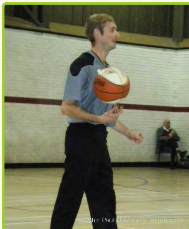
Árbitro EBF.