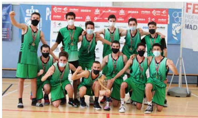
Júnior Preferente Masc. 2ª Div. Alameda de Osuna Verde