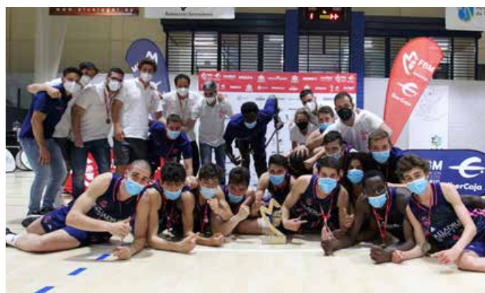
Cadete Especial Masculino Real Madrid A