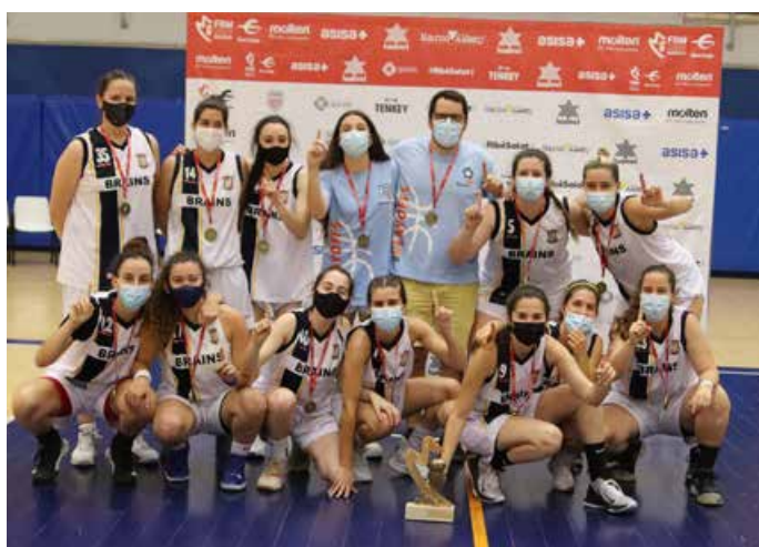
Primera Autonómica Femenina Brains Moraleja