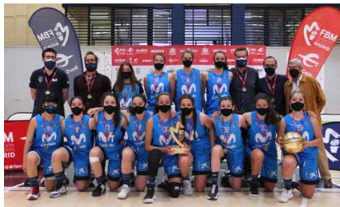
Infantil Especial Femenino Movistar Estudiantes A