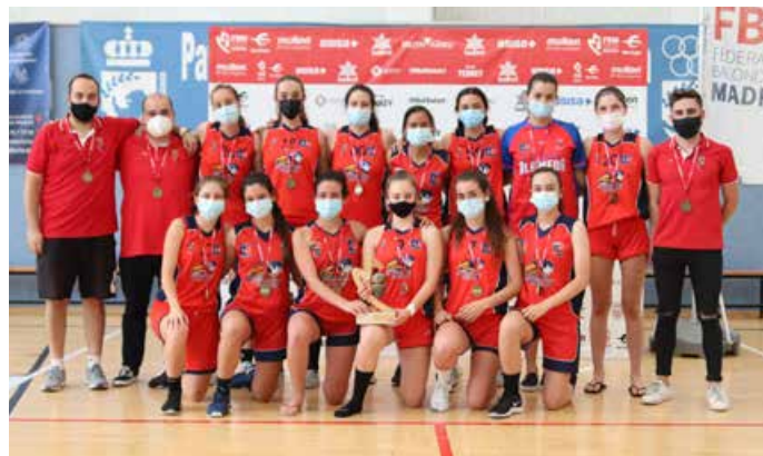
Júnior Preferente Fem. 2ª Div. Colegio Alameda de Osuna B