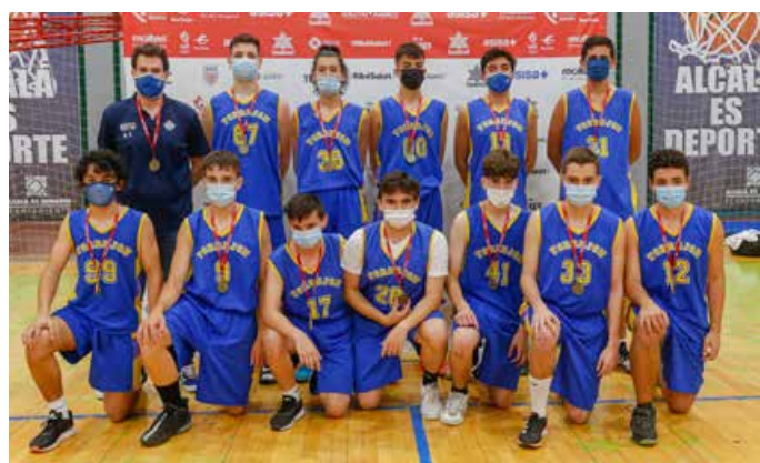
Cadete Preferente Masc. 4ª Div. Baloncesto Torrejón Azul