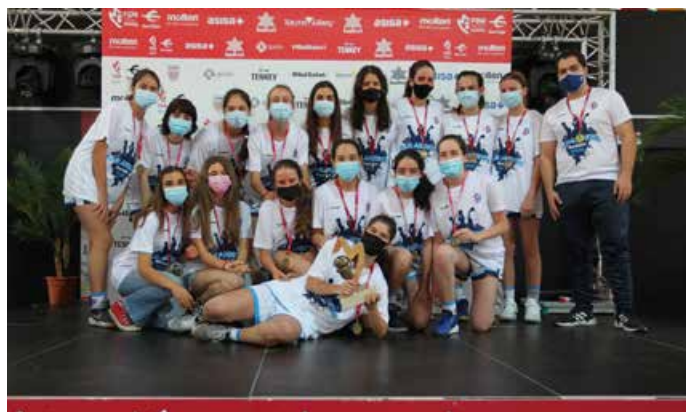
Cadete Preferente Fem. 2ª Div. San Agustín Madrid B