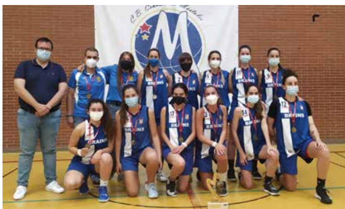
Segunda Autonómica Fem. Plata Brains Moraleja