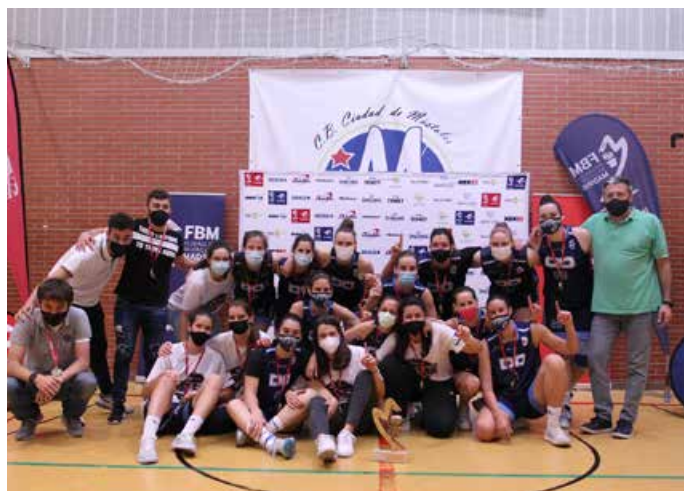
Primera Nacional Femenina Distrito Olímpico