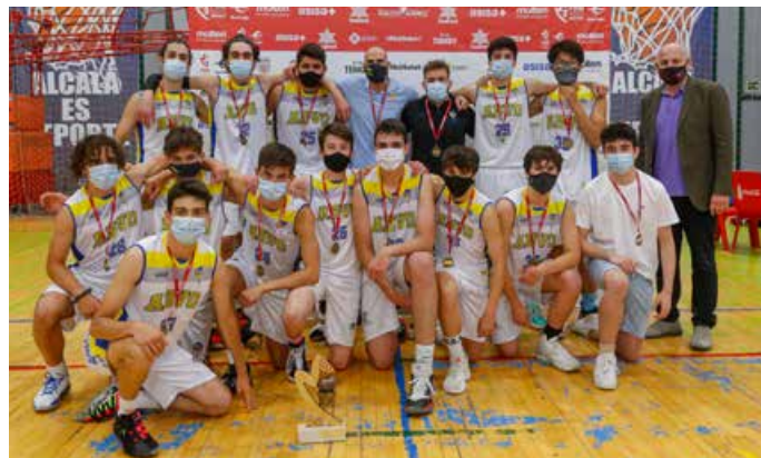
Cadete Preferente Masc. 3ª Div. Villaviciosa de Odón Azul