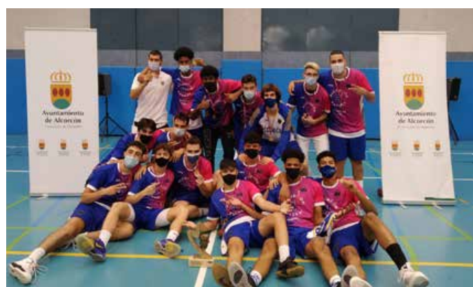
Sub'22 Masculino Plata Saltium Alcorcón Basket B