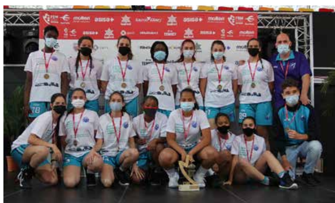
Cadete Preferente Fem. 3ª Div. CB Ciudad de Móstoles B