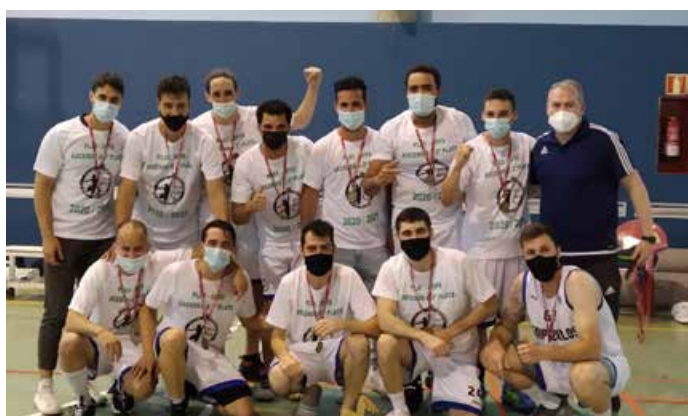
Segunda Autonómica Masc. Bronce CD Ciempobasket