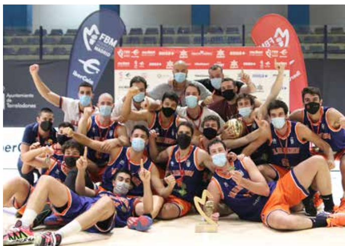
Primera Nacional Masculina Majadahonda