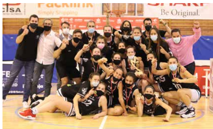
Júnior Especial Femenino Baloncesto Torreldones A