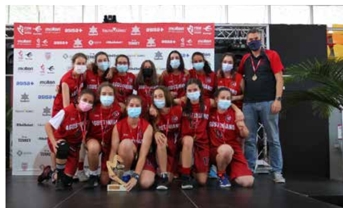
Infantil Preferente Fem. 2ª Div. Agustiniano