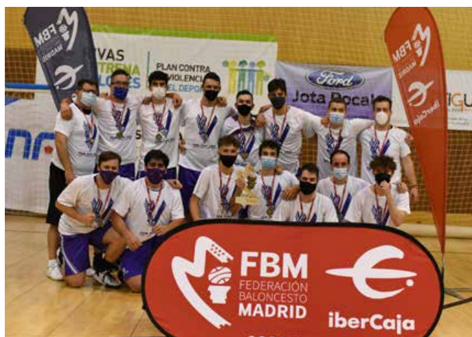
Prmera Autonómica Masc. Plata Tres Cantos