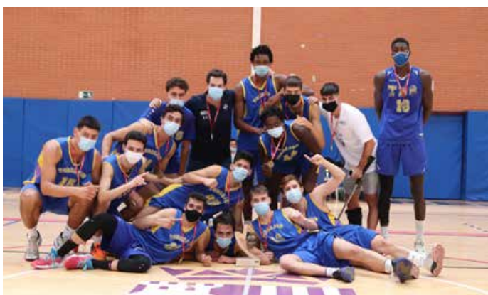
Sub'22 Masculino Oro Torrejón Basketball