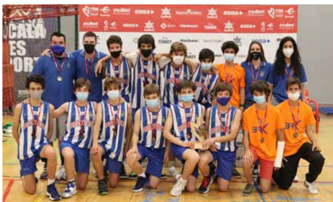
Infantil Preferente Masc. 1ª Div. Recuerdo SAD 07 A