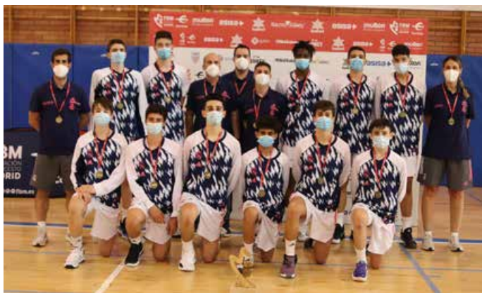
Infantil Especial Masculino Real Madrid A