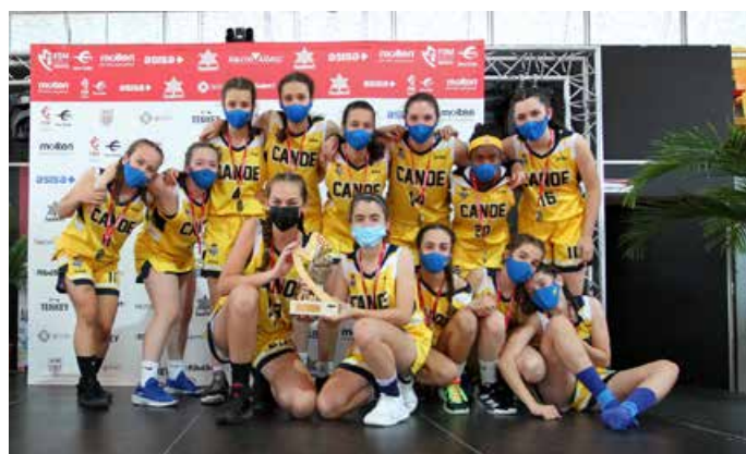
Preinfantil Femenino Real Canoe NC