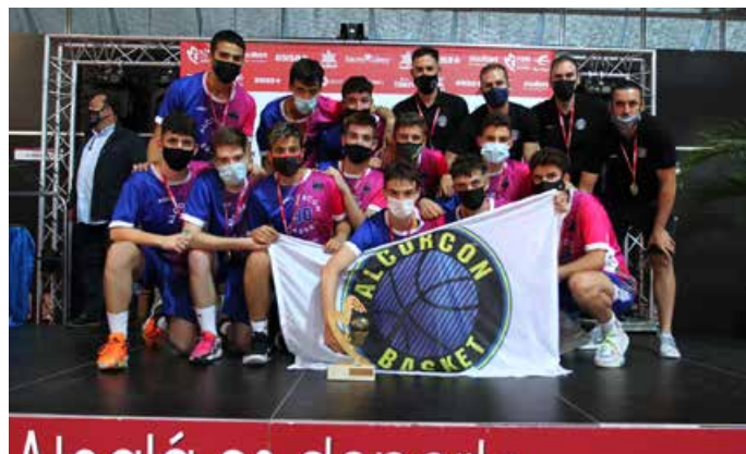
Cadete Preferente Masc. 1ª Div. Saltium Alcorcón Basket C