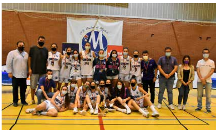
Sub'22 Femenino CB Ciudad de Móstoles