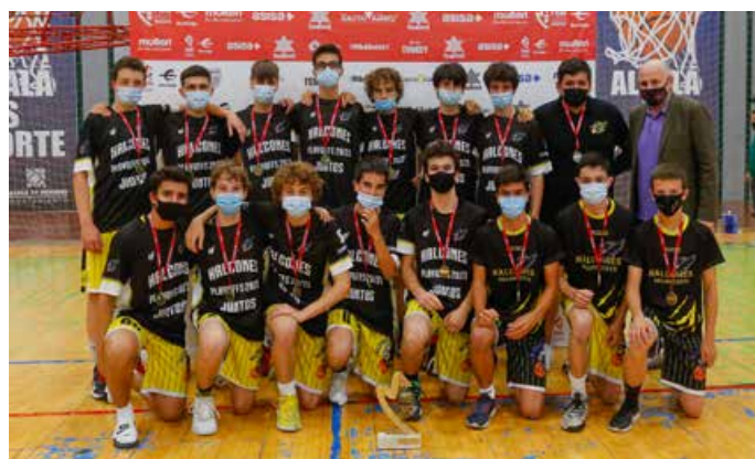
Cadete Preferente Masc. 2ª Div. Halcones Arroyofresno A