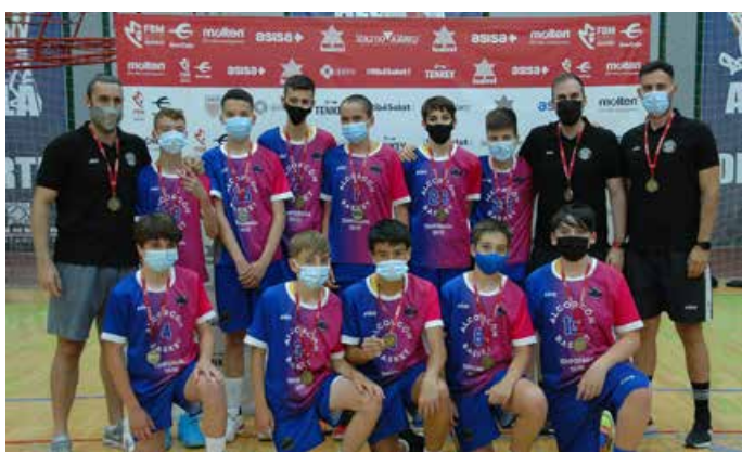
Preinfantil Masculino Saltium Alcorcón Basket