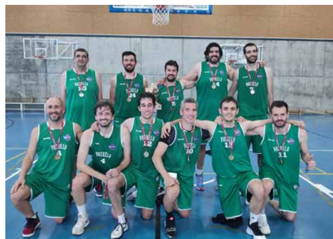
Segunda Autonómica Masc. Oro CB Pozuelo Cementerio de Elefantes