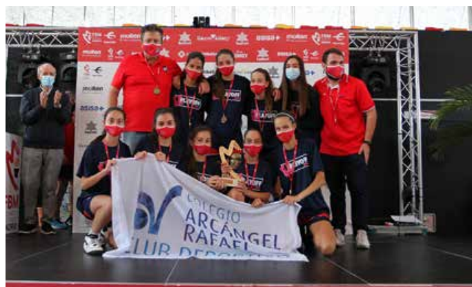
Infantil Preferente Fem. 1ª Div. Arcángel Rafael