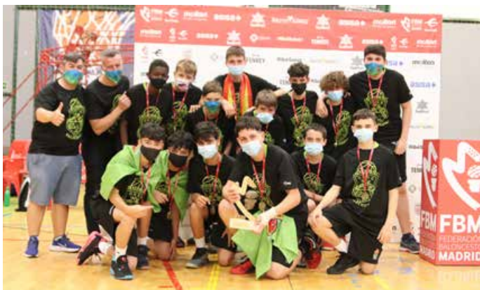
Infantil Preferente Masc. 2ª Div. Astrobasket Valdemoro