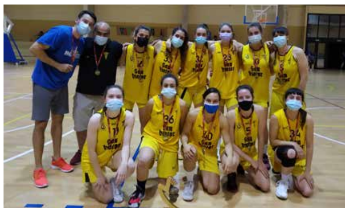
Segunda Autonómica Fem. Oro San Viator