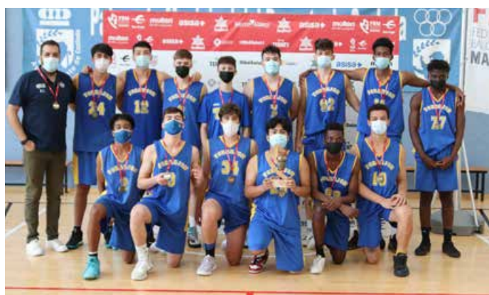
Júnior Preferente Masc. 3ª Div. Basket Torrejón