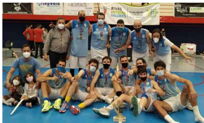
Segunda Autonómica Masc. Plata Colegio Miramadrid