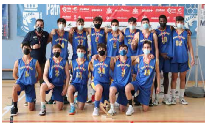
Júnior Preferente Masc. 1ª Div. Torrejón Basketball B