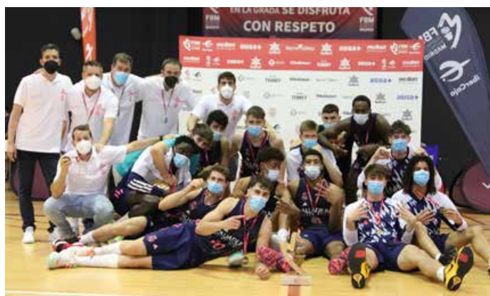
Júnior Especial Masculino Real Madrid