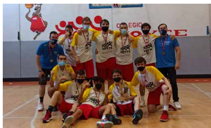
Sub'22 Masculino Bronce ADC Joyfe