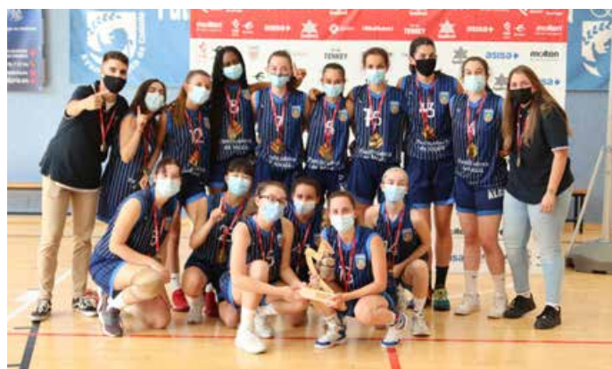
Júnior Preferente Fem. 1ª Div. Baloncesto Alcalá