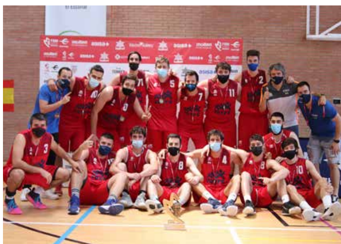
Primera Autonómica Masc. Oro ADC Joyfe