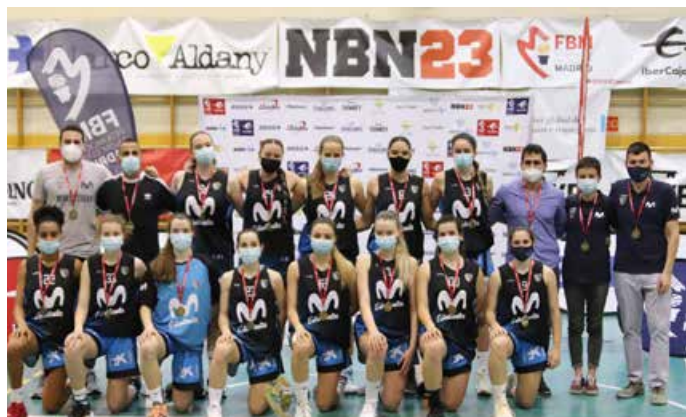
Cadete Especial Femenino Movistar Estudiantes A