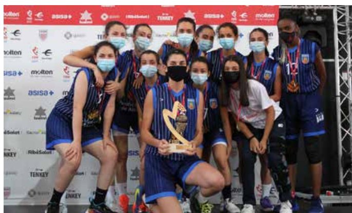
Cadete Preferente Fem. 1ª Div Baloncesto Alcalá Azul